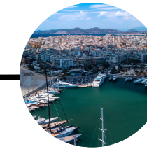
Puerto de pireo