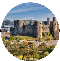
Norte de gales